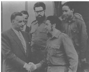
عبد الناصر مع جيفارا